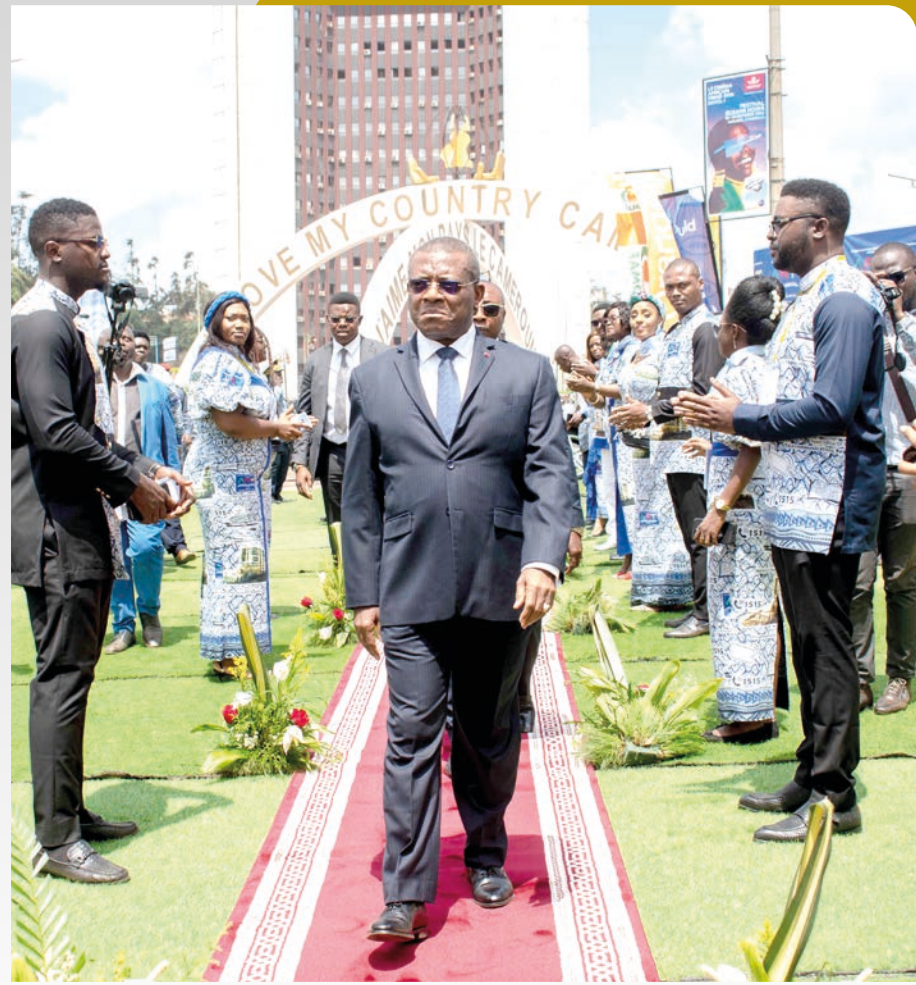
Arrivée du Premier Ministre Chef du Gouvernement, Chief Dr Joseph DION NGUTE à la place des Cérémonies.