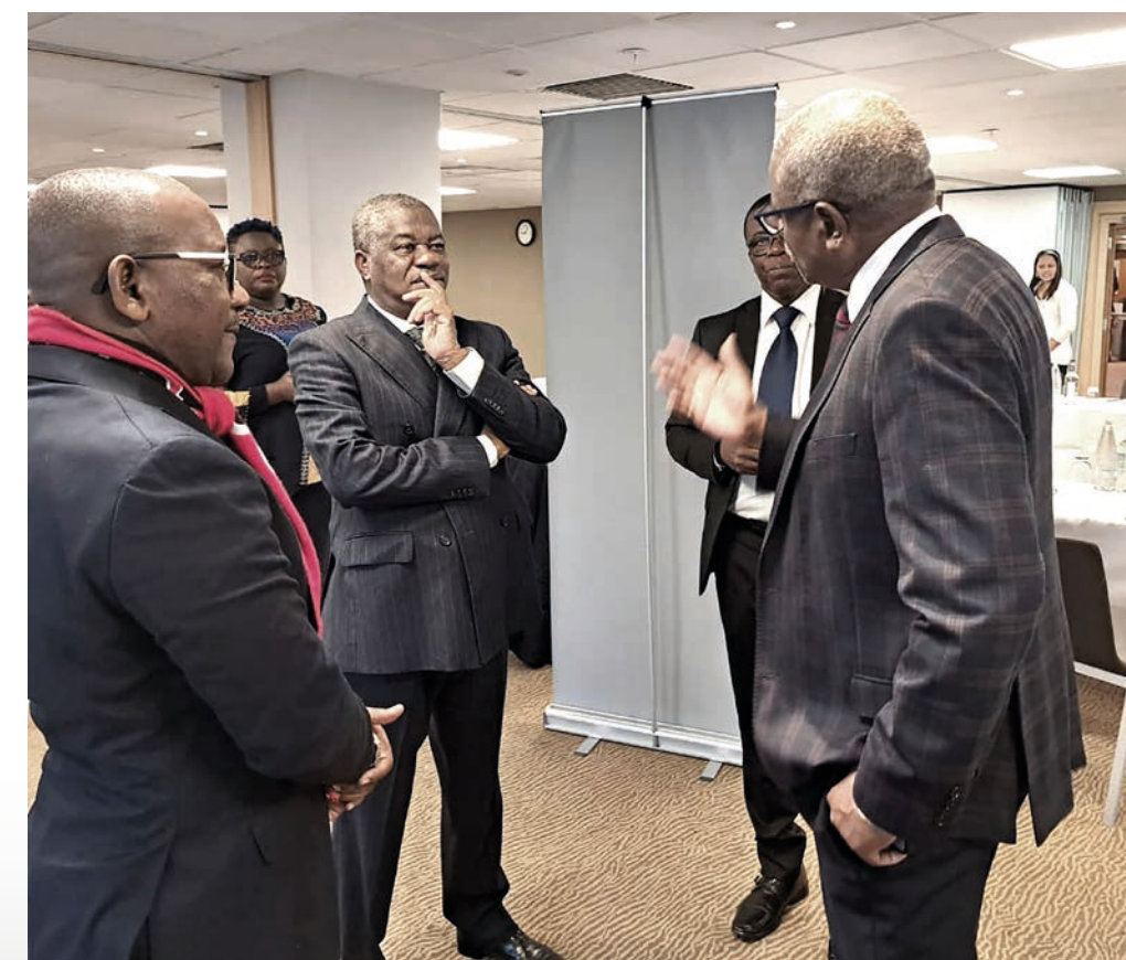
Le DG/ART impliqué dans les échanges et discussions.