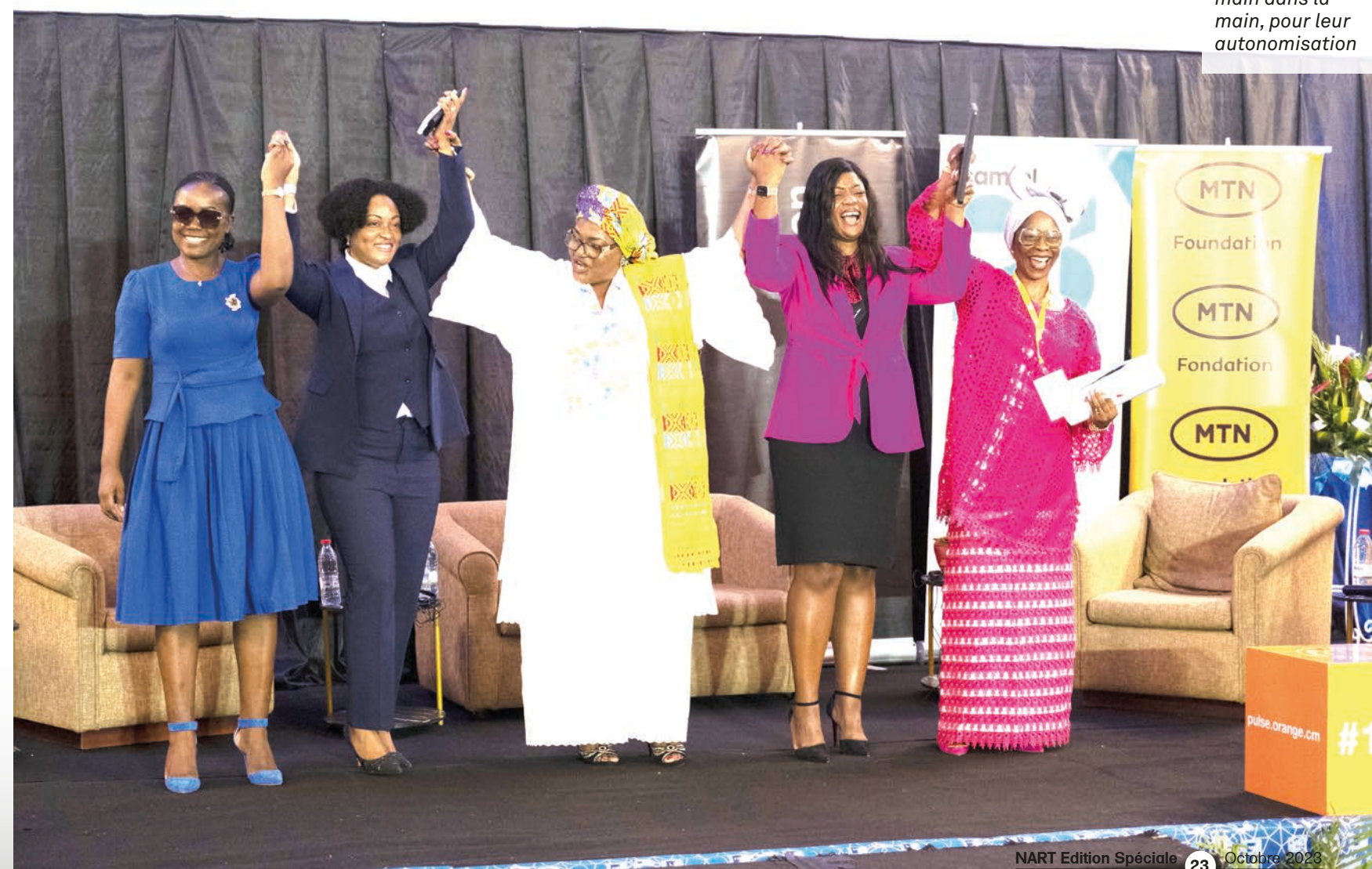
Les femmes main dans la main, pour leur autonomisation