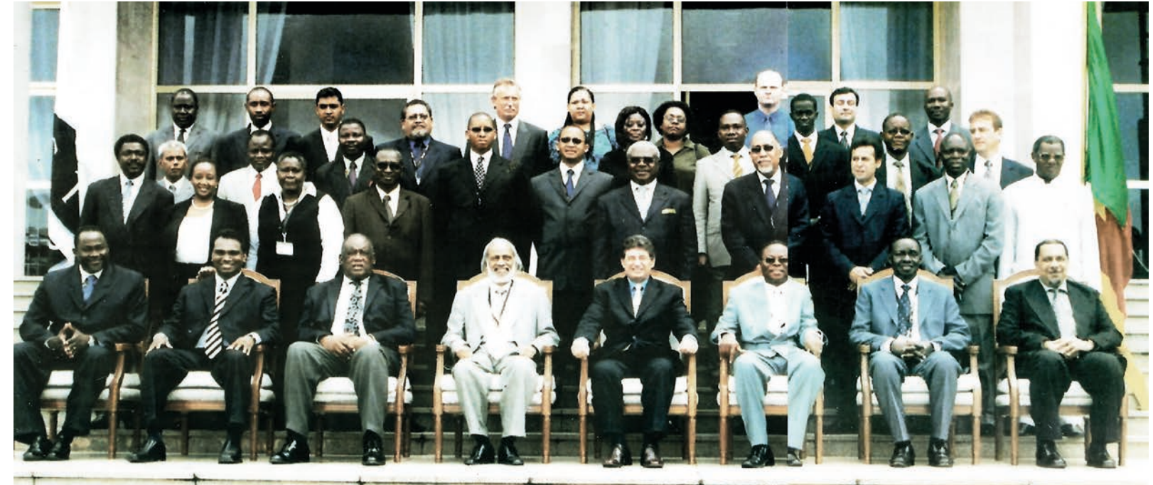
2010. An International CTO Workshop in Yaounde.