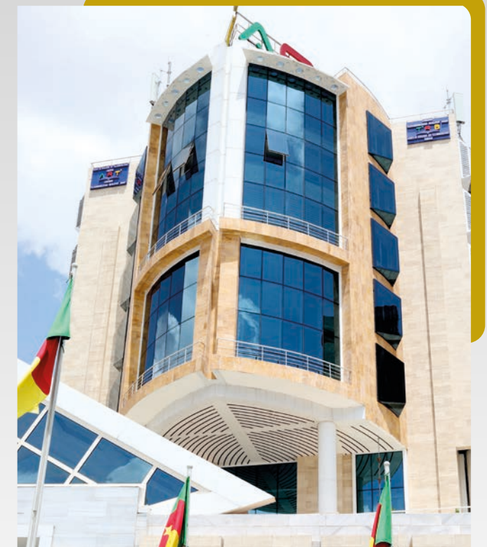
L'immeuble Platinum, fièrement dressé