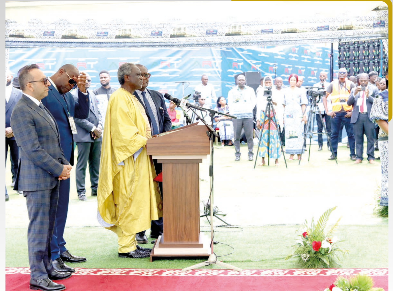
Présentation du projet de construction par le Maître d'œuvre.