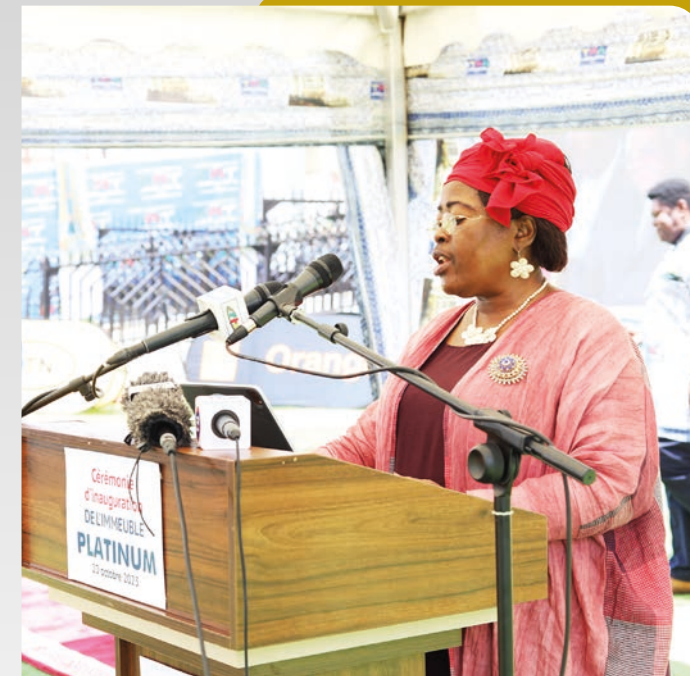
Allocution du Ministre des Postes et Télécommunications, Madame Minette LIBOM LI LIKENG.