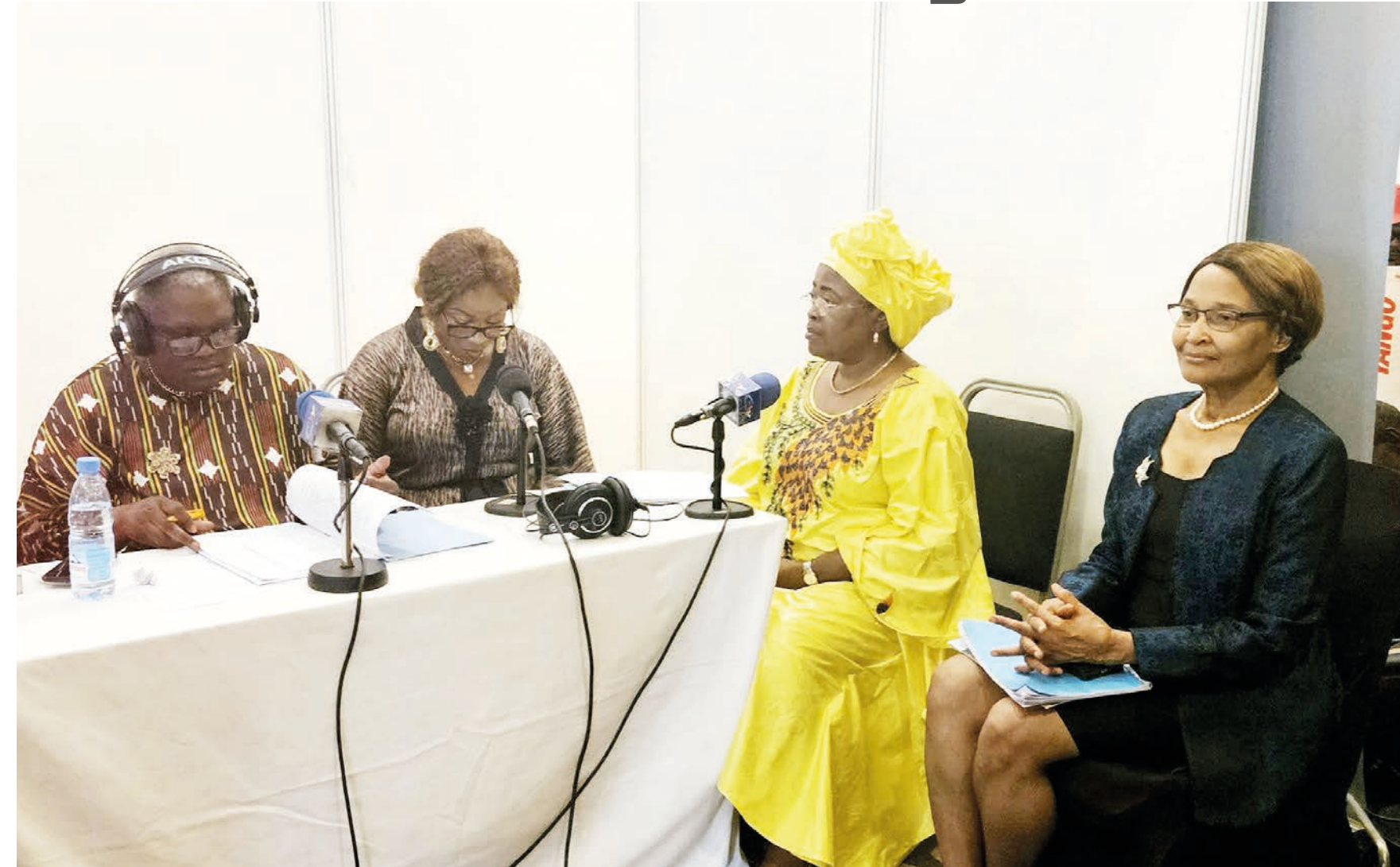
Le Ministre des Postes et Télécommunications et le Secrétaire Général du CTO en direct au Journal parlé de 13h sur la CRTV, produit depuis le site de la Digital Week Cameroon 2023.