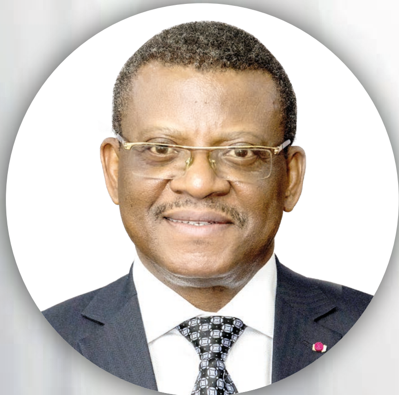
Joseph DION NGUTE Premier Ministre, Chef du Gouvernement