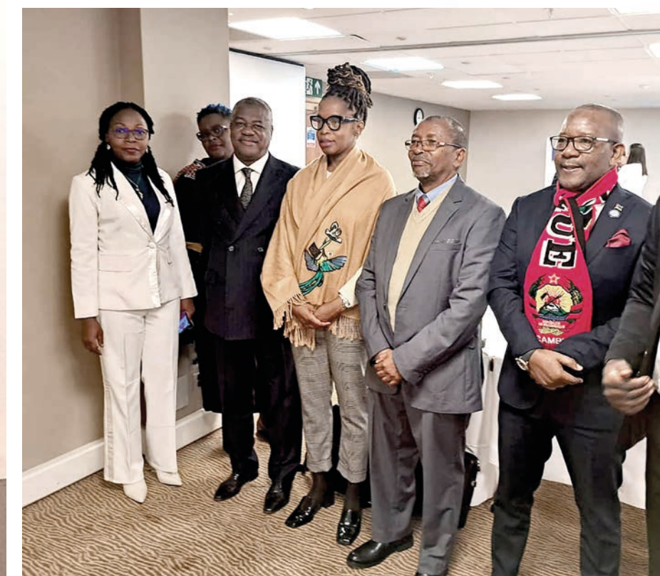
La délégation camerounaise en plaidoyer à Londres