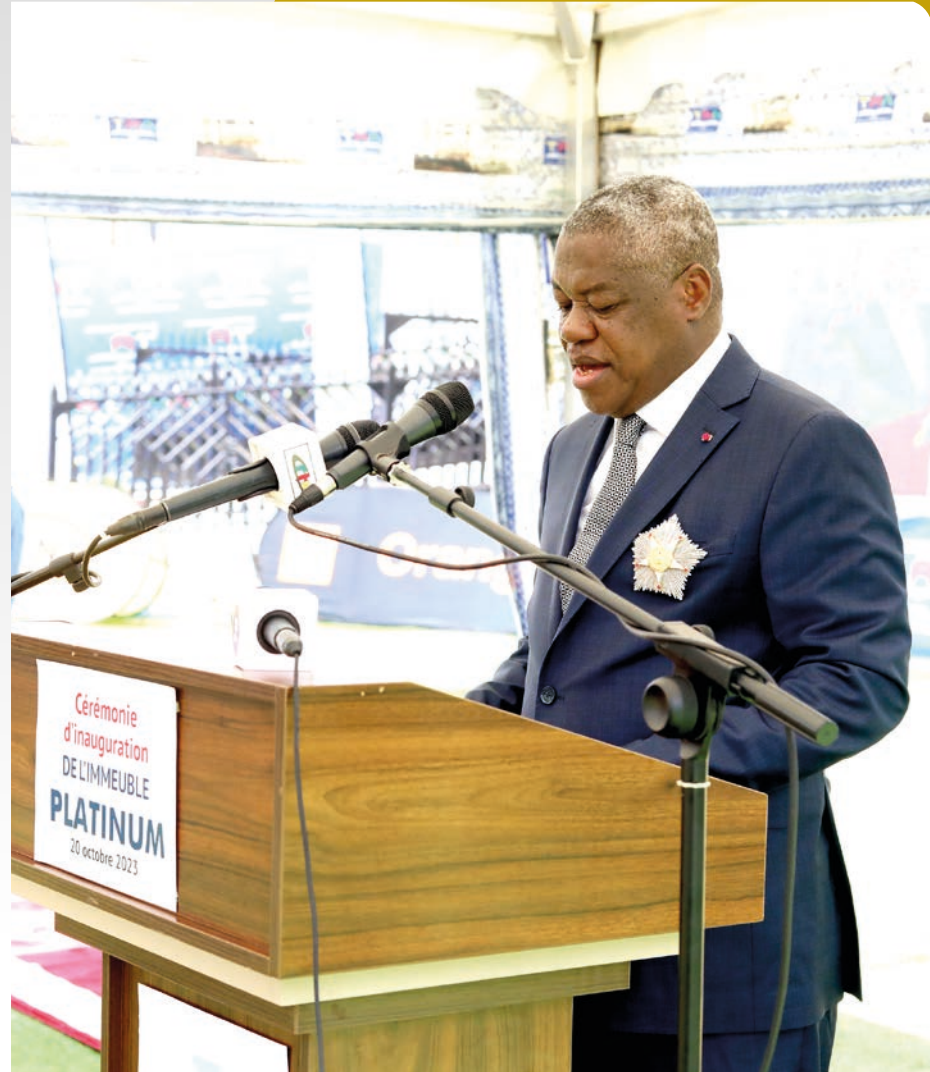
Allocution du Pr Philémon ZOO ZAME, Directeur Général de l'Agence de Régulation des Télécommunications (ART).

C'est un avantage au quotidien pour l'ensemble du personnel de travailler dans la plus belle artère de la ville de Yaoundé, voire du Cameroun. C'est aussi un privilège et un honneur de bénéficier d'une infrastructure moderne, fonctionnelle et répondant aux standards internationaux de confort et de sécurité.