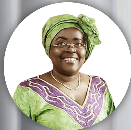
Minette LIBOM LI LIKENG Ministre des Postes et Télécommunications