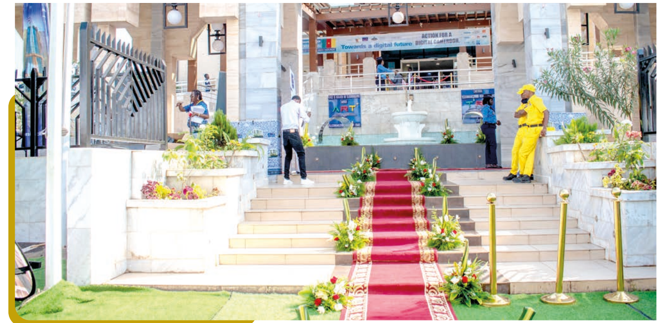
L'immeuble-siège paré pour le grand jour.