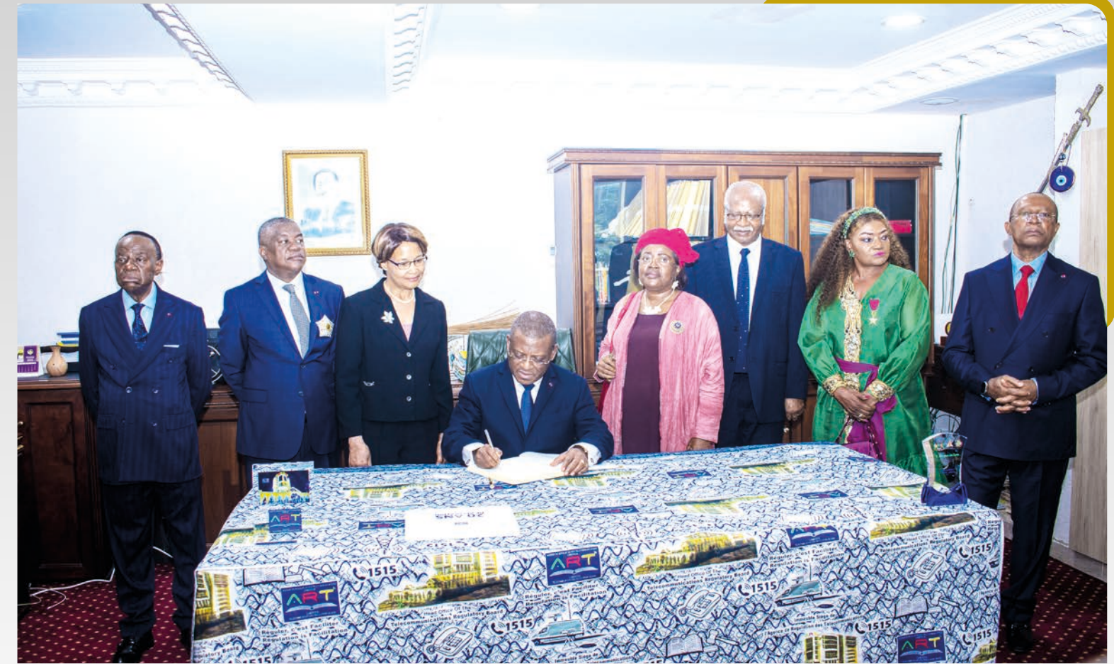
Signature du Livre d'Or par le Premier Ministre, Chef du Gouvernement