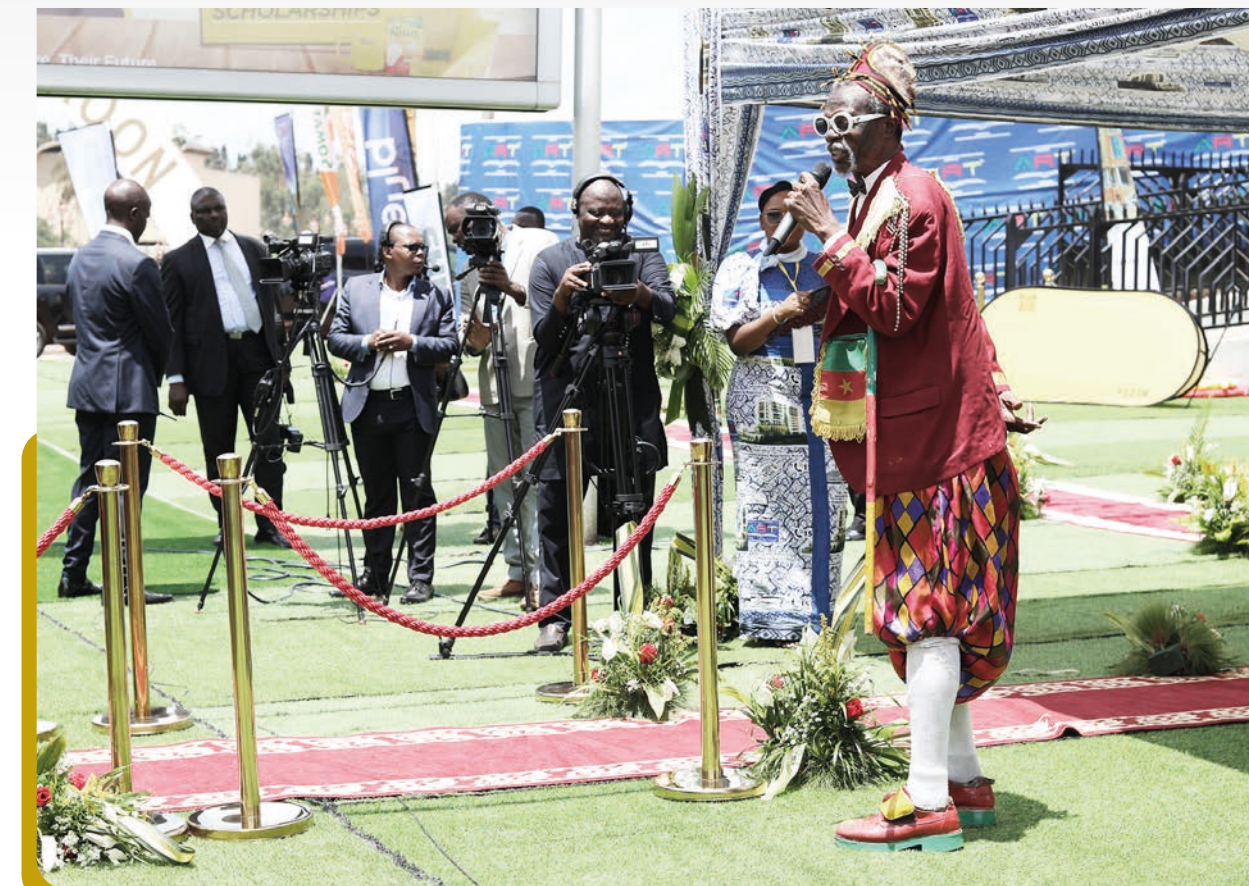
Intermède culturel au cours de la cérémonie