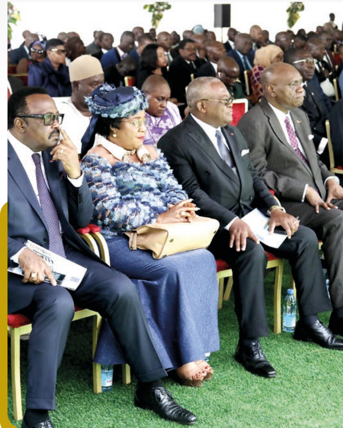
Un auditoire attentif.