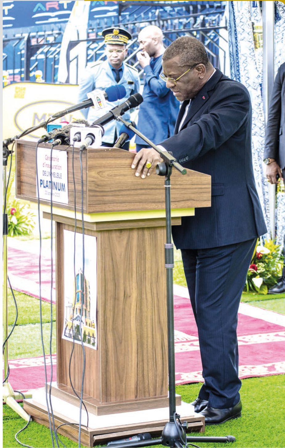
Allocution du Premier Ministre Chef du Gouvernement, Chief Dr Joseph DION NGUTE.

Priorité aux consommateurs des produits des télécommunications! Le service qui leur est destiné doit être de qualité. J'ai accompli l'office sur les marches de l'édifice ce 20 octobre 2023. L'immeuble siège de l'ART «Platinum» incarne l'ambition d'émergence du Cameroun.