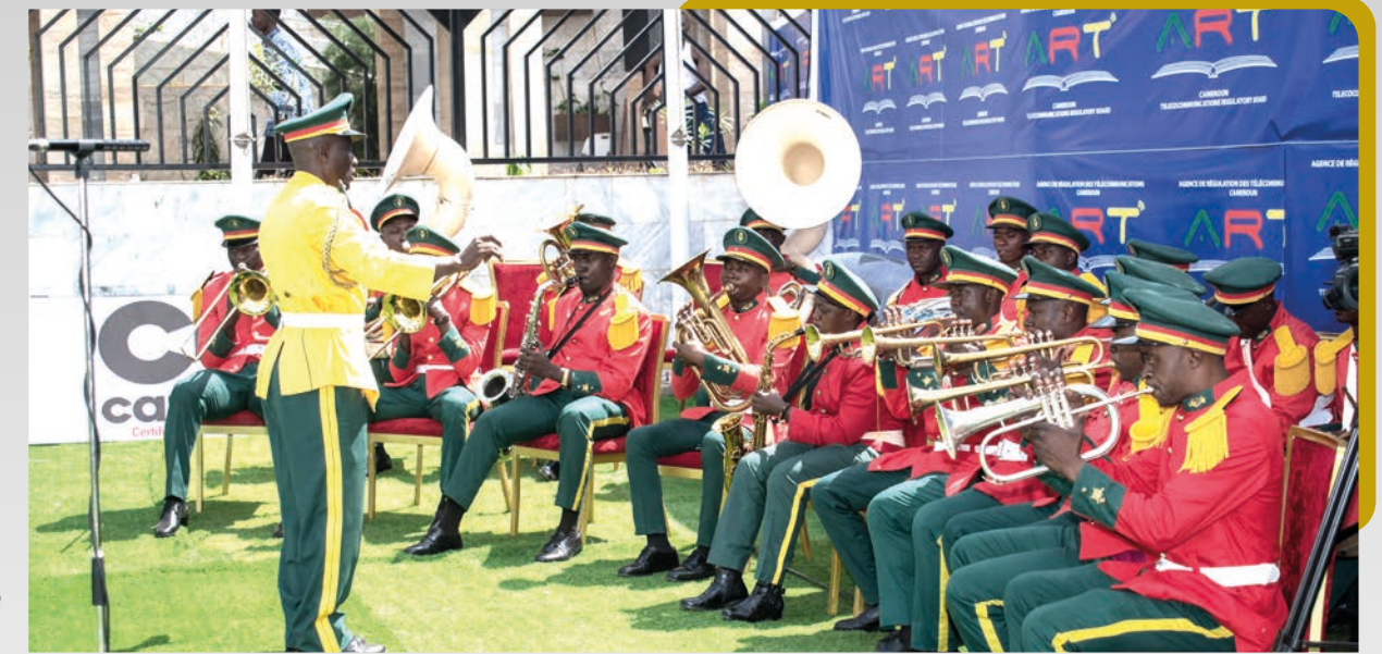
Exécution de l'hymne national.