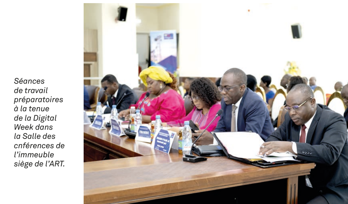
Séances de travail préparatoires à la tenue de la Digital Week dans la Salle des conférences de l'immeuble siège de l'ART.