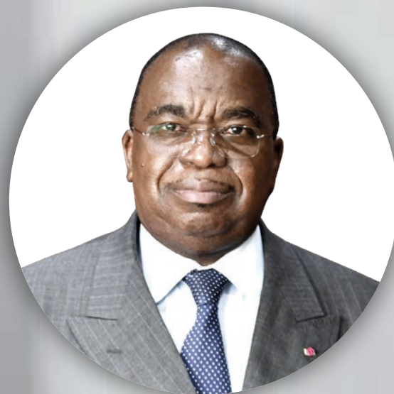
Louis Paul MOTAZE Ministre des Finances