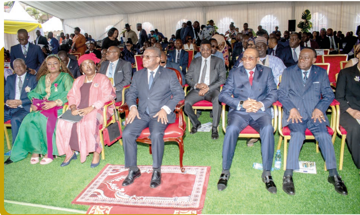
Une vue de la tribune officielle.